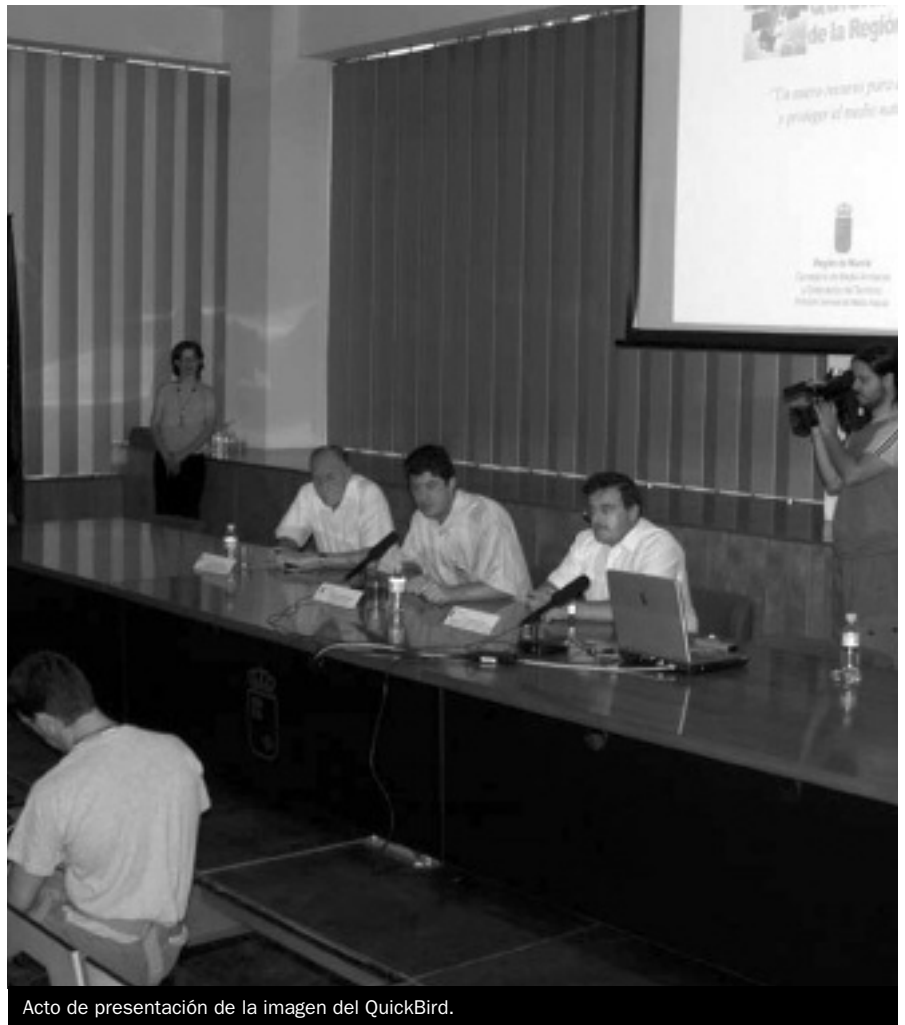
Acto de presentación de la imagen del QuickBird.

Los estudios más frecuentemente utilizados, a partir de esta información del satélite, son clasificaciones estadísticas, análisis multivariantes y algoritmos de imágenes, como son los índices de vegetación.