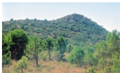
Cumbre de la Sierra del Carche donde se ubica el área a reforestar.