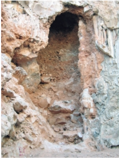
Detalle del yacimiento

La importancia del yacimiento se basa en la abundancia y variedad de la asociación faunística encontrada, diversidad de taxones de moluscos y vertebrados; en el buen estado en que se encuentra dada la edad del mismo; y en la posibilidad de encontrar restos humanos.