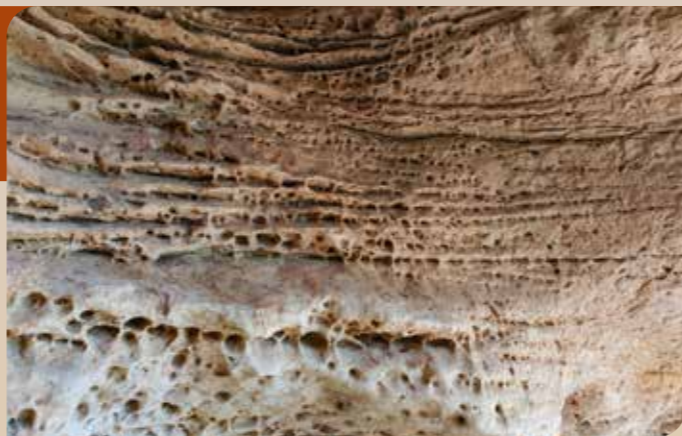
Erosión eólica en nido de abeja

El viento y el agua moldean el paisaje. Así, la filtración del agua en las rocas ha dado lugar a formaciones como la