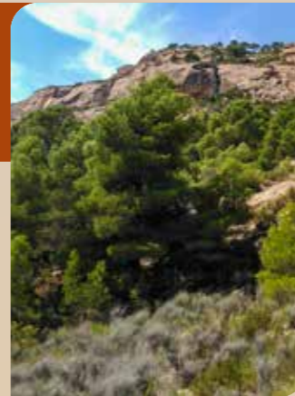
El pinar es la vegetación predominante

En menor medida están presentes el madroño ( Arbutus unedo ), la cor-