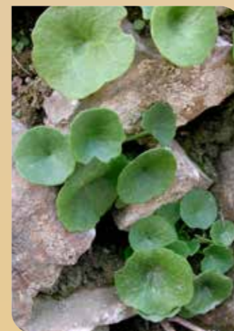
Ombligo de Venus

Es de resaltar la presencia de un ejemplar de pino carrasco de gran tamaño, situado junto al camino de acceso a la casa del Guarda, inventariado como árbol singular.