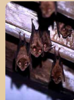
Murciélago grande de herradura

En el grupo de los mamíferos destacan diferentes especies de murciélagos que disponen de numerosos recovecos para refugiarse, como la galería denominada "Cueva del Tesoro". Entre ellos se encuentra el murciélago grande de herradura ( Rhinolophus ferrumequinum ) y el murciélago rabudo ( Tadarida teniotis ).