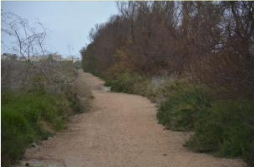
Sendero- Vista de tarays a podar