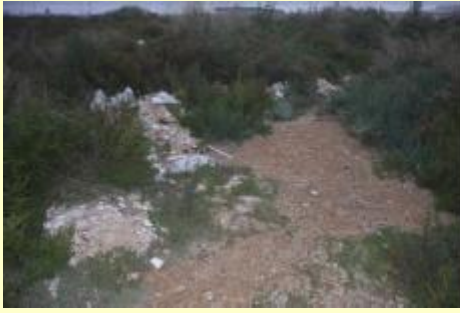
Escombros y otros residuos a retirar, en el sendero desde/hacia El Mojón