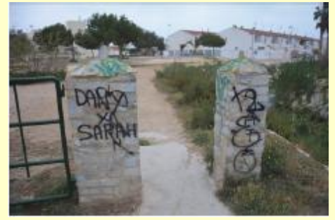
Pintadas a limpiar en el acceso desde El Mojón