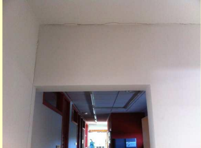
Grieta entre los dos módulos del edificio