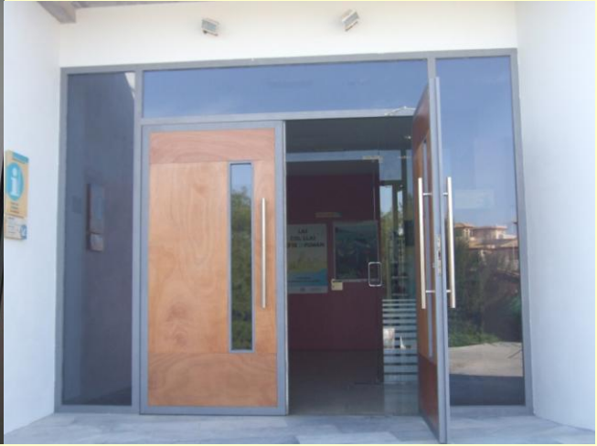
Puertas saneadas y cristales sustituidos