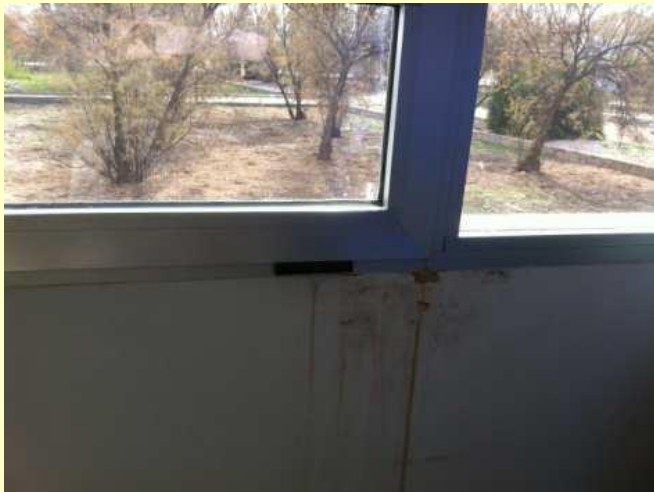
Humedad en ventanas