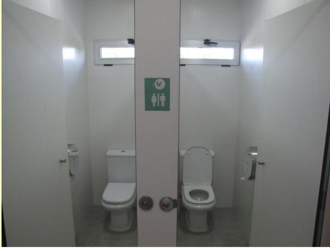
Nuevos aseos del Centro de Visitantes