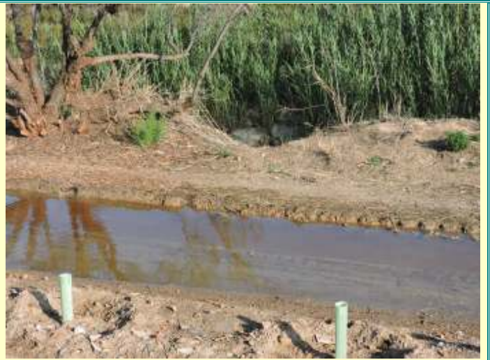
“Sendero de los Tarays” tras periodos de lluvias