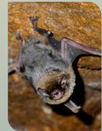
Murciélago de cueva

En el grupo de mamíferos están presentes, entre otros, el tejón ( Meles meles ), el gato montés ( Felis silvestris ), así como diferentes especies de murciélagos entre las que destaca, por su grado de amenaza, el murciélago de cueva ( Miniopterus schreibersii ).