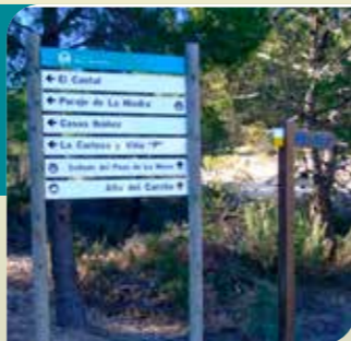
Señalización en el Parque Regional

El mejor modo de conocer el Parque es recorriendo los itinerarios existentes . Uno de ellos es el sendero "SL-JU-2 Torre del Rico a la cumbre del Carche" que permite ascender de manera cómoda a la cumbre del Carche y disfrutar de sus magníficas vistas. Otro recorrido que se puede realizar es el del sendero "SL-JU-3 Casas de La Rosa a Barranco del Saltador".