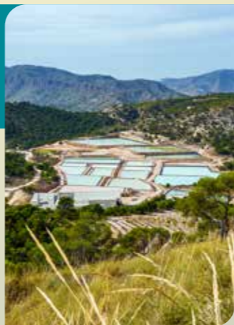
Diapiro Salino de la Rosa

Se trata del afloramiento salino de mayor extensión de la Región de Murcia.