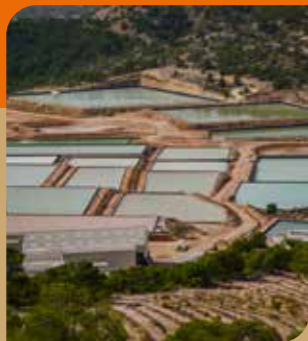
Salinas de la Rosa

Numerosos elementos culturales y etnográficos ponen de manifiesto la presencia humana en este territorio a lo largo de la historia. Existen diversos yacimientos arqueológicos de la Edad del Bronce, así como asentamientos ibéricos y romanos , entre estos últimos destacan la Cueva del Castellar, Los Castillicos del Salero y la Romanía, donde se han descubierto restos de varias villas y un acueducto. En la zona del Cabezo de la Sal se han encontrado fragmentos de cerámicas medievales.