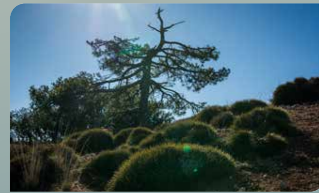
Vegetación de las cumbres

La conservación de la Sierra de El Carche se inicia en 1992 con la Ley de Ordenación y Protección del Territorio, declarándose Parque Regional en 2003. En la actualidad forma parte de la Red europea de espacios naturales Red Natura 2000 por estar declarado Lugar de Importancia Comunitaria (LIC) al albergar diferentes hábitats de interés europeo.