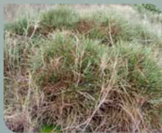
Cojín de monja

De especial interés botánico son los tomillares sobre yesos que se encuentran en el Cabezo de la Rosa. En las zonas más bajas dominan los espartales ( Stipa tenacissima ) y donde existe poca pendiente y suelos profundos se cultivan vid, olivo y almendro.