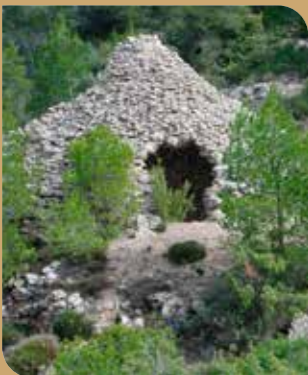
Pozo de la nieve

Si bien el interior del Parque se encuentra despoblado, en las estribaciones de la sierra se encuentran los núcleos de Raspay, El Carche y La Alberquilla y, de forma dispersa, se localizan diversos caseríos.