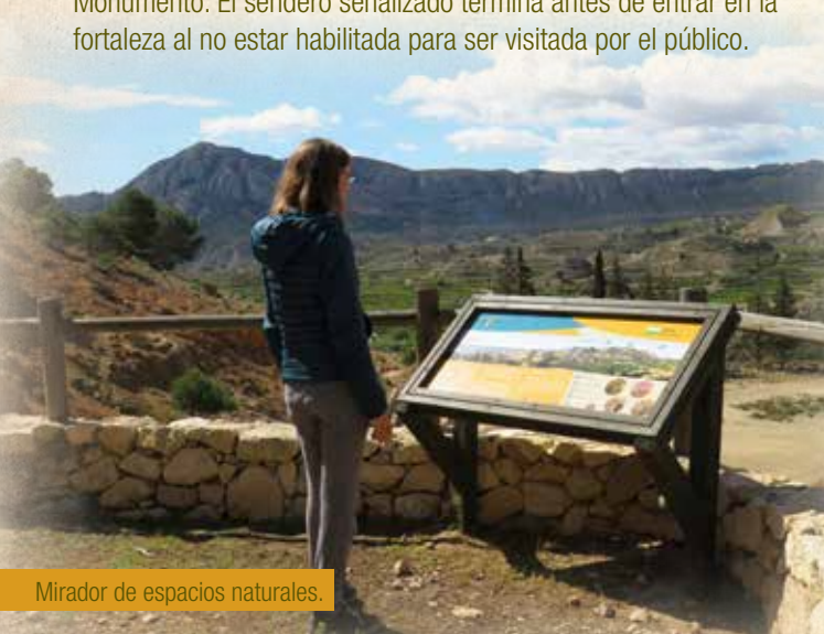
Mirador de espacios naturales.