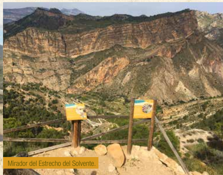
Mirador del Estrecho del Solvente.