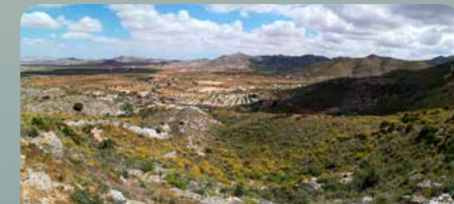
Campos y cabezos de Tallante