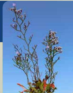
Siempreviva de Cartagena

En los roquedos se encuentran especies adaptadas a condiciones extremas de falta de suelo y de agua como los zapaticos de la Virgen ( Sarcocapnos enneaphylla ) y el cardo amarillo de roca ( Centaurea saxicola ).