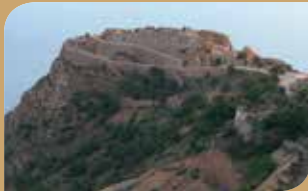
Batería de Castillitos

La práctica de deportes en la naturaleza como el senderismo, el buceo, el piragüismo o la escalada, son actividades que cada vez más personas se animan a practicar.