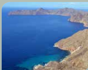
Acantilados de Cabo Tiñoso