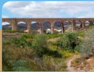
Acueducto de Perín

La actividad humana tradicional forma parte del paisaje tal y como ponen de relieve los diferentes elementos etnográficos que dan testimonio de una forma de vida adaptada al territorio. Así, en la zona se da una actividad agrícola con cultivos de secano, principalmente de almendro y, en menor medida, olivos y algarrobos. Asociados a estos aparecen casas rurales diseminadas acompañadas a menudo con infraestructuras de interés cultural como pozos, aljibes y pequeñas norias de tracción animal que singularizan esta zona costera. Diferentes ermitas rurales, como las de Perín, La Muela y la de la rambla del Cañar, construidas tras la consolidación de los núcleos de población (finales del s. XVII y comienzos del XVIII) se encuentran localizadas normalmente en zonas elevadas. También se sigue desarrollando ganadería de ovino y caprino que supone un componente importante en la actividad económica de la zona. En las diferentes pedanías se pueden adquirir productos elaborados de manera artesanal, como embutidos y quesos.