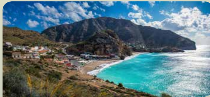
Playa del Portús