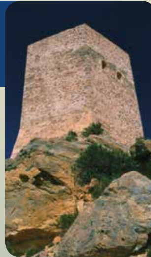
Torre de Santa Elena

Su costa también cuenta con un elevado valor ecológico, con presencia de fanerógamas marinas, cuevas sumergidas y arrecifes artificiales, y se encuentra protegida tanto por el LIC Franja Litoral Sumergida como por la Reserva Marina de Cabo Tiñoso.