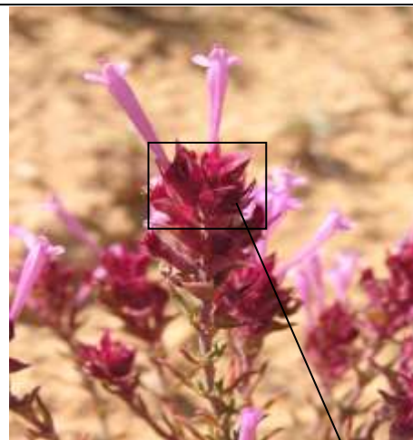
Ejemplar de Thymus funkii (Detalle de brácteas diferentes a las hojas)