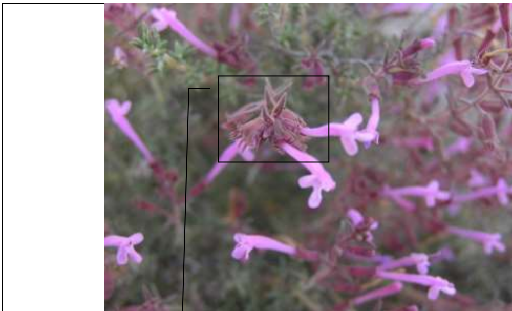
Ejemplar de Thymus antoniae Detalle de brácteas diferentes a las hojas