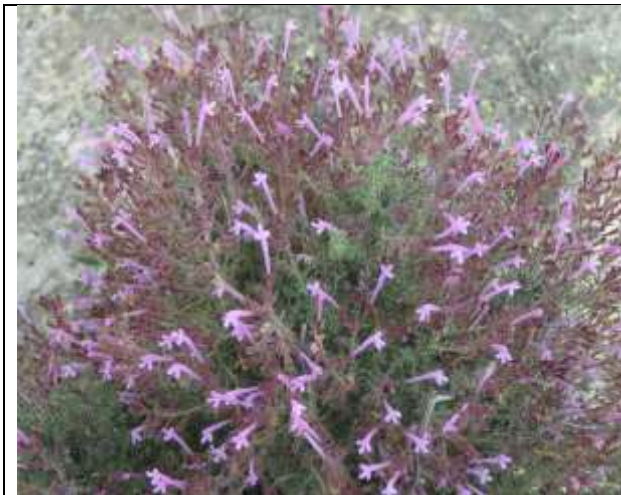
Ejemplar de Thymus antoniae