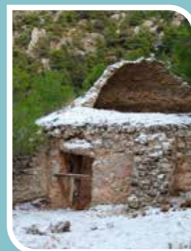
Pozo de la Nieve nevado