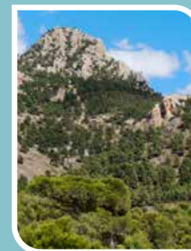
Pico de los Cenajos