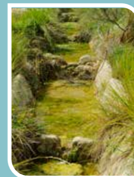
Abrevadero de Fuente Higuera