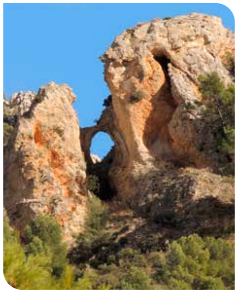
Cañón de los Cenajos