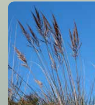
Esparto ( Stipa tenacissima )

El matorral que destaca en la Sierra de las Moreras es el esparto (Stipa tenacissima) , que se combina con especies que transitan entre el norte de África y el sur de la península ibérica, como el palmito (Chamaerops humilis) , el arto (Maytenus senegalensis) , el azufaifo (Ziziphus lotus) , la aliaga (Calicotome intermedia) , la aulaga (Launaea arborescens) o el oroval (Whitania frutescens) .