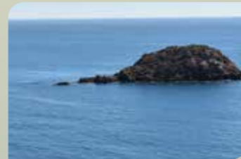
Isla Cueva de Lobos

El matorral que predomina en el paisaje se torna más denso en las zonas de umbría. También destacan algunos pinares bien desarrollados como el que se encuentra en el paraje de Algezares .