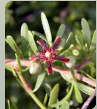
Cornical ( Periploca angustifolia )

El pino carrasco (Pinus halepensis) se presenta en forma de pinar abierto en el paraje de Algezares, intercalándose con algunos ejemplares de carrasca (Quercus rotundifolia) en el collado de la Paridera.