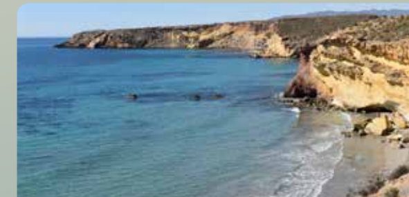
Playa amarilla y Punta Negra

La ocupación histórica de este territorio por el ser humano ofrece grandes valores culturales como el yacimiento arqueológico Cabezo del Plomo , perteneciente a la Edad del Cobre, declarado Bien de Interés Cultural .