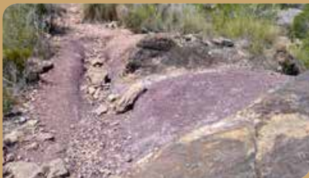
Tierras láguenas, yesos y “caleras”.

La histórica actividad minera que cesó a mediados del siglo XX, deja en la sierra indudables muestras como los hornos de yeso del Barranco de Algezares ( aljez significa yeso en árabe), que se empleaban para deshidratar el mineral antes de molerlo para su uso en construcción. También se observan restos de la extracción de “láguenas” , las tierras violáceas que se utilizaban para impermeabilizar los tejados de las viviendas.