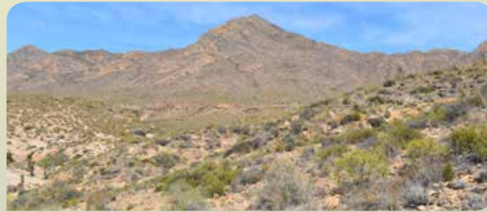
Cabezo de las Víboras

entre calas de enorme belleza como Playa Amarilla, Playa de la Grúa o Playa de Cueva de Lobos , donde destacan los colores ocres y rojizos de los materiales rocosos. Varios barrancos y ramblas desembocan en la zona costera como la Rambla del Picacho o el Barranco de las Siete Revueltas .