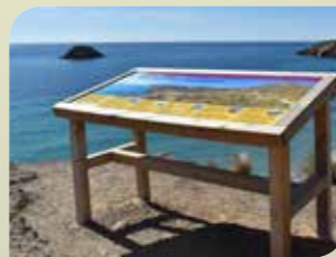
Mirador Playa Cueva Lobos

El mejor modo de conocer este espacio protegido es a pie, a través de los distintos senderos que recorren la Sierra de las Moreras, respetando las indicaciones sobre restricciones de circulación en los períodos de cría de aves rapaces.