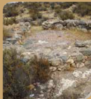
Restos arqueológicos: yacimientos y hornos.

La huella del ser humano en la Sierra de las Moreras está presente desde antiguo, tal y como pone de manifiesto el yacimiento arqueológico de la Edad del Cobre “Cabezo del Plomo” , situado en las estribaciones de la sierra y declarado Bien de Interés Cultural. Este poblado fortificado de hace 3000 años a.n.e. conserva restos de enterramientos, una apreciable muralla y los restos de cabañas circulares que han sido recreadas recientemente.