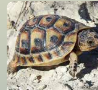
Tortuga mora ( Testudo graeca )

Entre los mamíferos una especie de interés es el erizo moruno (Atelerix algirus) . El entorno tan árido de la Sierra de las Moreras condiciona la presencia de anfibios, entre los que se encuentra el sapo corredor (Bufo calamita) .