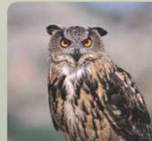
Buho real ( Bubo bubo )

Las aves son las reinas de la fauna del Paisaje Protegido y, entre ellas, dominan las rapaces como el águila perdicera (Aquila fasciata) , el halcón peregrino (Falco peregrinus) o el búho real (Bubo bubo) que aprovechan los cortados rocosos de la sierra para nidificar.