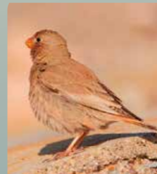
Camachuelo trompetero ( Bucanetes githagineus )

Otras aves menos conocidas ocupan las zonas de matorral como la collalba negra (Oenanthe leucura) , la curruca rabilarga (Sylvia undata) o el camachuelo trompetero (Bucanetes githagineus) , pequeña ave propia de ambientes norteafricanos. La influencia costera permite que aves marinas, como el invernante charrán patinegro (Sterna sandvicensis) , utilicen para descansar las laderas de la Sierra de las Moreras.